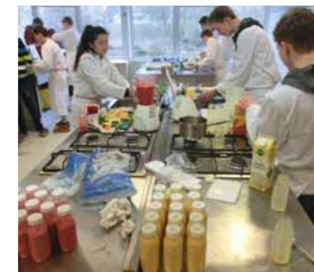
T&T-leerlingen werken aan het smoothieproject klas 3 op het ROC Wellantcollege afdeling Food.

De bedoeling is leerlingen de kans te geven zoveel vaardigheden en kennis aan te leren, dat zij een verkorte leerroute voor drie technische leerwegen kunnen volgen: Mechatronica, Greentec en Commerciële technologie. Om dat op een goede manier te laten verlopen, wordt er nauw samengewerkt met het mbo in de regio. De locatie Hof van Delft kende al de talentontwikkeling techniek. Deze wordt nu in